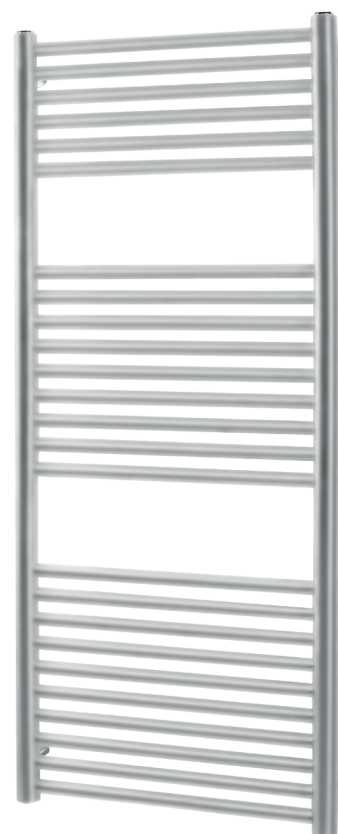
Italo inox satinato

Радиаторы укомплектованы набором крепежных деталей для закрепления на стене и выпускным клапаном. Материал – INOX AISI 304 Давление при испытании – 9 бар Рабочее давление – 6 бар