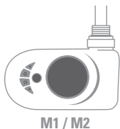
M1 / M2