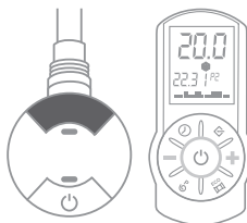
SP1 / SP2