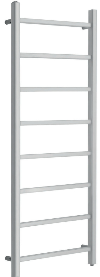
tower 20 inox satinato

Радиаторы укомплектованы набором крепежных деталей для закрепления на стене и выпускным клапаном. Материал – INOX AISI 304 Давление при испытании – 4 бар Рабочее давление – 9 бар