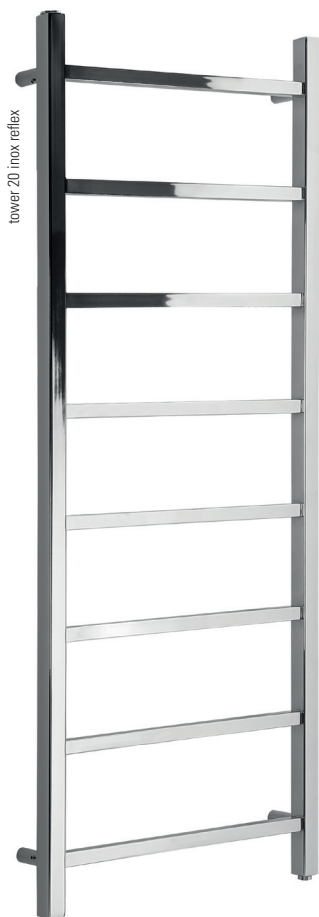
tower 20 innox reflex

Interasse dal centro foro al muro min. 70 / max 95 mm. Distance between hole center and wall min. 70 / max 95 mm. Distance du centre du trou au mur min. 70 / max 95 mm. Abstand zwischen Lochmitte und Wand min. 70 / max 95 mm. Distancia entre el centro del agujero y el muro min. 70 / máx 95 mm. Расстояние между центром отверстия и стеной – не менее 70 мм и не более 95 мм.