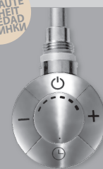
H1CR / H2CR

NOVITÀ NEW NOUVEAUTÉ NEUHEIT NOVEDAD НОВИНКИ