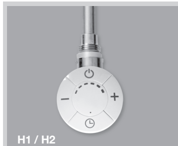
H1 / H2

Электротен только справа и расположен вертикально в коллекторе.